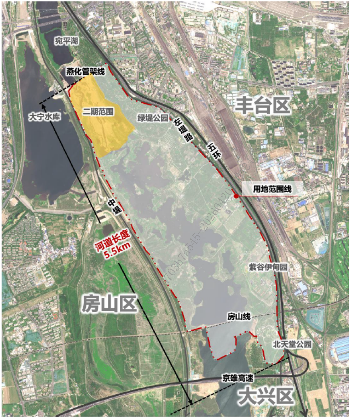
图 1.1-1 项目治理范围